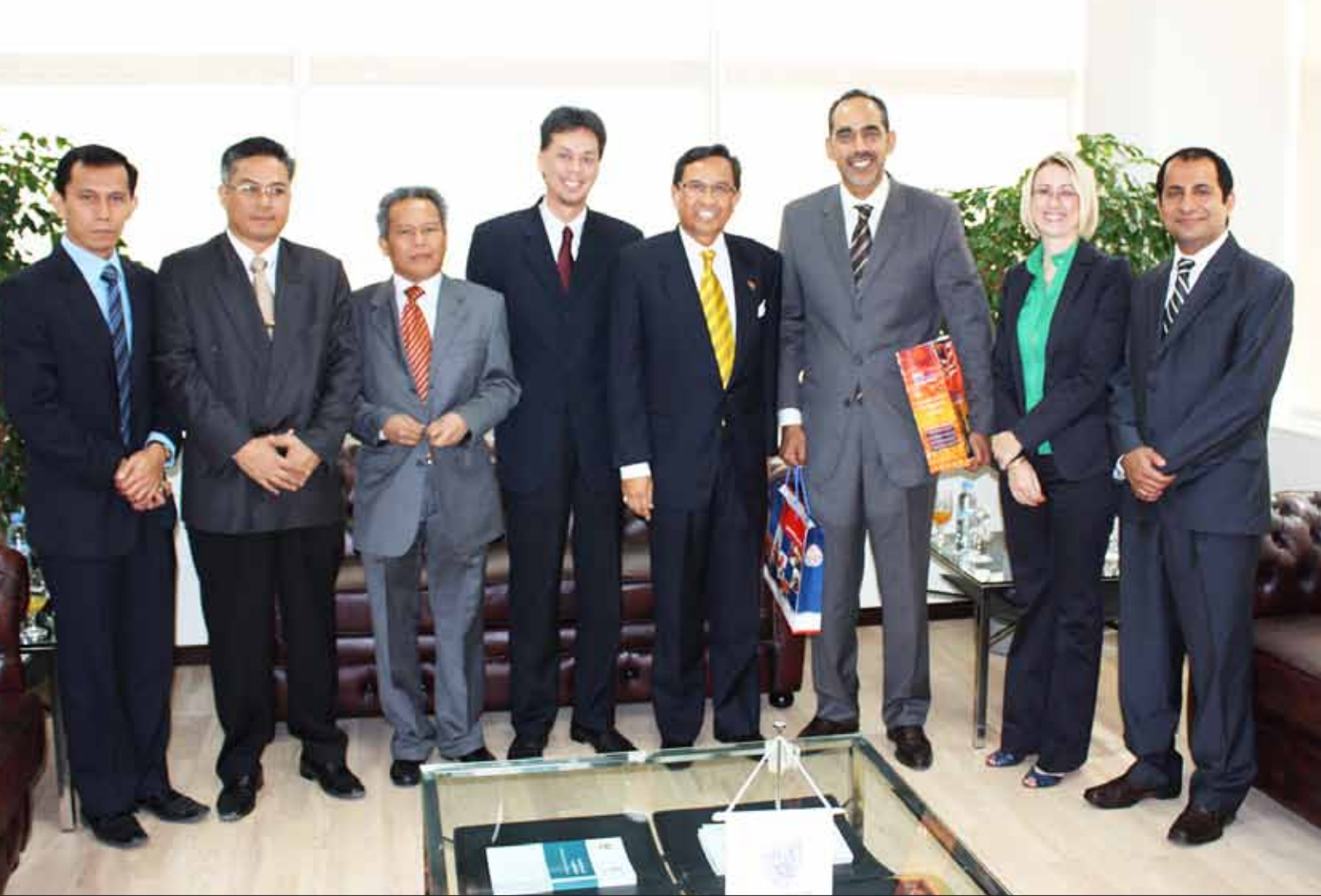
الوفد الماليزي مع مسؤولي كلية دبي للإدارة الحكومية

الممكنة للتعاون المستقبلي وخبرات التنمية في ماليزيا والإمارات العربية المتحدة.