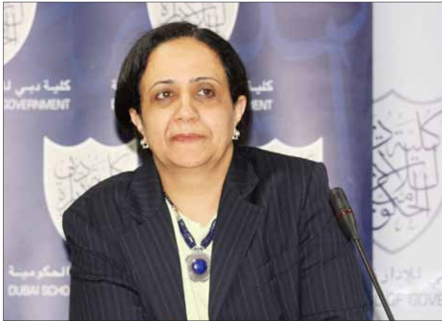
سعادة أمة العليم السوسوة

11 يونيو، 2009، ألقى سعادة أمة العليم السوسوة، الأمين العام المساعد، المدير المساعد ومديرة المكتب الإقليمي للدول العربية لبرنامج الأمم المتحدة الإنمائي محاضرة ضمن سلسلة منتديات البحث حول النوع الاجتماعي والسياسة العامة تحت عنوان "أثر الأزمة الاقتصادية على المساواة بين النوع الاجتماعي في العالم العربي". وقامت بتقديمها للحضور مي الدباغ، التي افتتحت المحاضرة بالحديث عن "حل الأزمة من خلال تضيق الفجوة: إعادة صياغة قواعد لعبة عدم المساواة بين الجنسين في المؤسسات في العالم العربي".