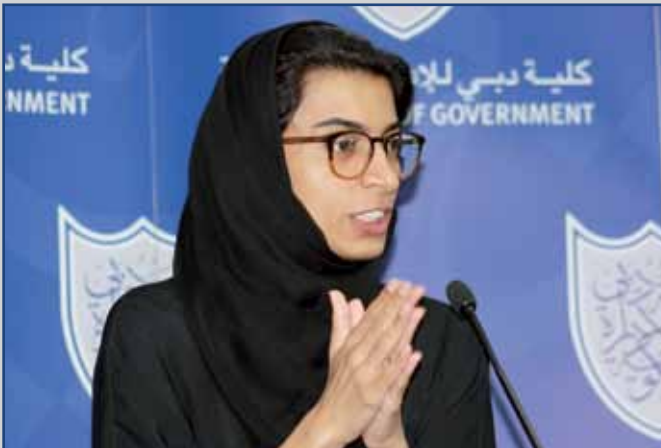
سعادة نورة الكعبي

نظم برنامج النوع الاجتماعي في 21 مارس ورشة عمل حول إدارة المرحلة الانتقالية بين الدراسة الأكاديمية والعمل، بحضور حشد من الطلبة الإماراتيين من الجامعات الرئيسية في دولة الإمارات العربية المتحدة.