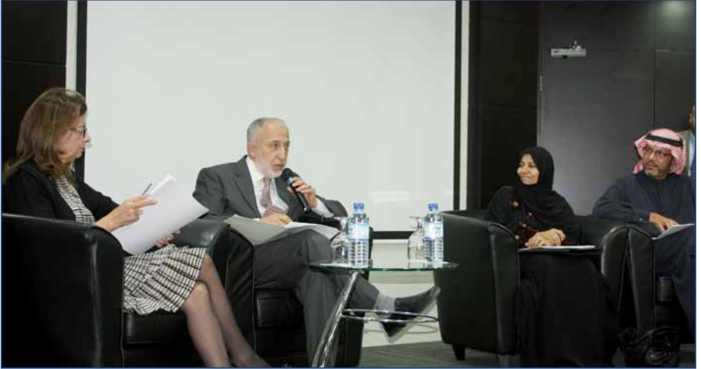
منتدى سياسات التعليم الأول الذي نظّمته كلية دبي للإدارة الحكومية بالاشتراك مع هيئة المعرفة والتنمية البشرية

والتعلم والتنمية البشرية. ولذلك نعتزم، من خلال جلسات النقاش المفتوحة، وبمشاركة عدد كبير من الخبراء من بينهم الناشطون على شبكات التواصل الاجتماعي، إعادة النظر والتركيز على الدور الجوهري الذي يلعبه الوالدان في تطوير مهارات أولادهم على المستوى التعليمي. كما أننا سنقدم خطوات عملية يمكن للوالدين تطبيقها في الحياة اليومية لأولادهم الطلاب بما يعزز مستويات الوعي والتقدم لديهم».