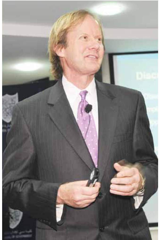
نائب رئيس شركة سيسكو، جيمس جرين