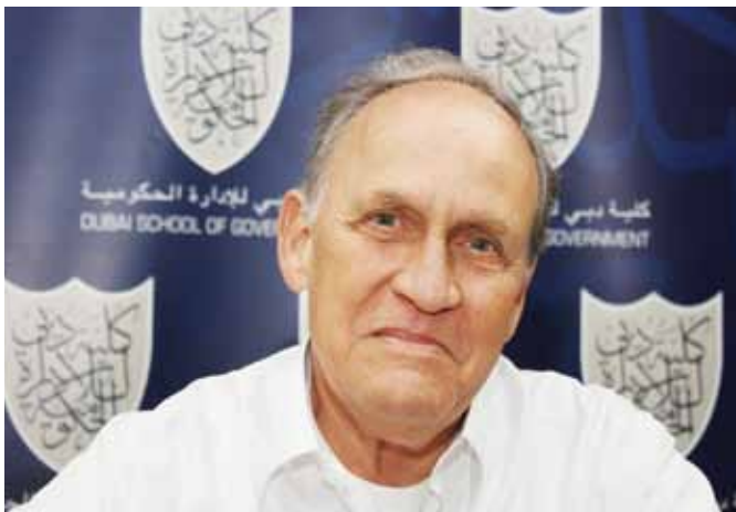
البروفيسور جيفري ويليامسون

وبينما يبدو الاستثمار المباشر خيار جذاب لصناديق الثروة السيادية في الوقت الحالي، فقد أكد ليرنر أن "تتبع حركة الاستثمار المباشر توجي بالحاجة لتوخي الحذر".