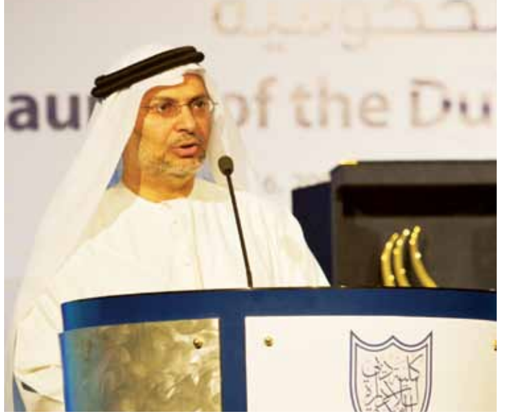
معالي الدكتور قرقاش يوجه كلمة إلى رابطة خريجي كلية دبي للإدارة الحكومية.

واعترافاً منها بالدعم الذي حظت به من شركائها، قدمت الكلية شهادات تقديرية لعدد من المؤسسات والمنظمات الرائدة؛ من بينها بنك دبي الوطني، مايكروسوفت، بنك دبي التجاري، دائرة دبي للسياحة والتسويق التجاري، إدارة الجنسية والإقامة في دبي، غرفة تجارة وصناعة دبي، داماس المجتمع، سيسكو، مؤسسة محمد بن راشد آل مكتوم، وهيئة كهرباء ومياه دبي.