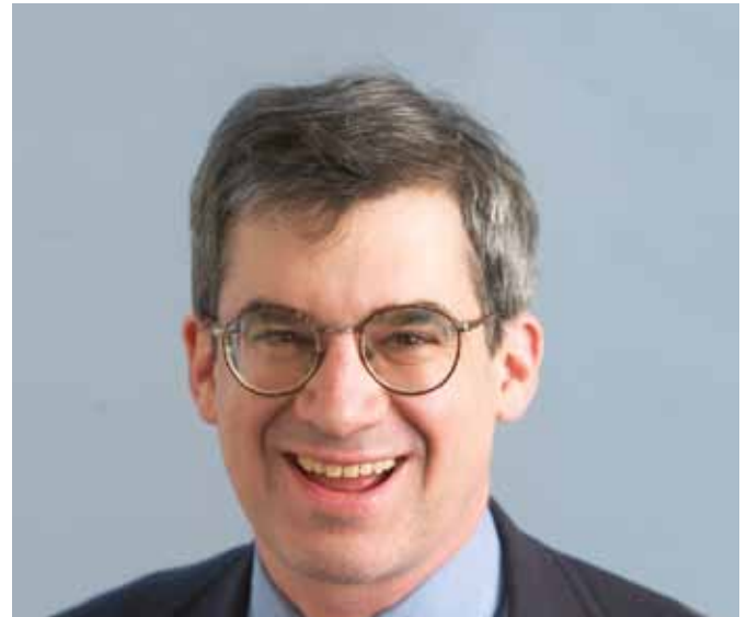
البروفيسور جوش ليرنر

تحدث البروفيسور جوش ليرنر، من كلية هارفارد للأعمال عن "الشكل الجديد لرؤوس الأموال الخاصة: صناديق الثروة السيادية والاستثمار الخاص" في 3 مارس. أوجز د. ليرنر عدداً من المخاوف المصاحبة لاستثمار رؤوس الأموال الخاصة، بما ذلك دورات الاستثمار البديل، النجاح البالغ ثم فشل أكبر الصناديق المالية، التي تعتمد بقوة على الاستدانة لاتمام عمليات الشراء، وهو هيكل للرسم عفا عليه الزمن وتستخدمه معظم الصناديق المالية، دورات اقتصادية متكررة من الإنتعاش/ الانكماش، وتركيز رأس المال في صناديق مالية دون مستوى الأداء.