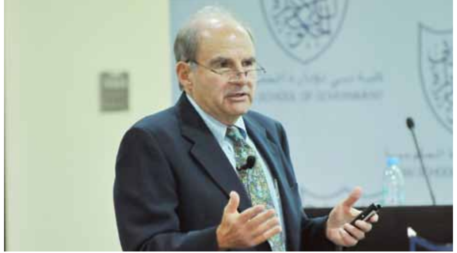
البروفيسور جورج ريتزر

تنبأ البروفيسور ريتزر بانقراض العديد من قلاع الاستهلاك مثل مراكز التسوق العملاقة، وسفن التنزه الفاخرة، والكازينوهات الفندقية، والملاهي قريباً، إذ تكشف الأزمة الاقتصادية الراهنة طبيعتها غير المستدامة. كما أشار إلى وجود الكثير من مراكز التسوق "الميتة" في الولايات المتحدة الأمريكية التي لم يعد الناس يرتادونها نتيجة لتقلص الافتتان بها أو لانخفاض القوة الشرائية.