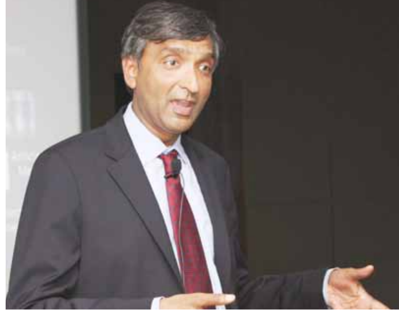
نائب رئيس مجموعة مايكروسوفت ، أنوب جويتا

تلعب التكنولوجيا، في عالمنا المعاصر، دوراً كبيراً في التعليم والتمكين، وهما أهم عاملين يزيدان من قدرة المجتمع على الدخول إلى عالم المعلومات والمساهمة الفعالة في تقليل معدلات الفقر- حسب ما صرح به أنوب جويتا - نائب رئيس مجموعة مايكروسوفت بوتنيشبال اللامحدودة. جاءت ملاحظات جويتا خلال محاضرتة التي ألقاها في 13 ابريل بكلية دبي للإدارة الحكومية بعنوان ”القضايا الاجتماعية الرئيسية ورؤية مايكروسوفت التكنولوجية“. وقد حضر هذه الفعالية عددا كبيرا من الطلاب وصُناع السياسة وغيرهم من الشركاء.