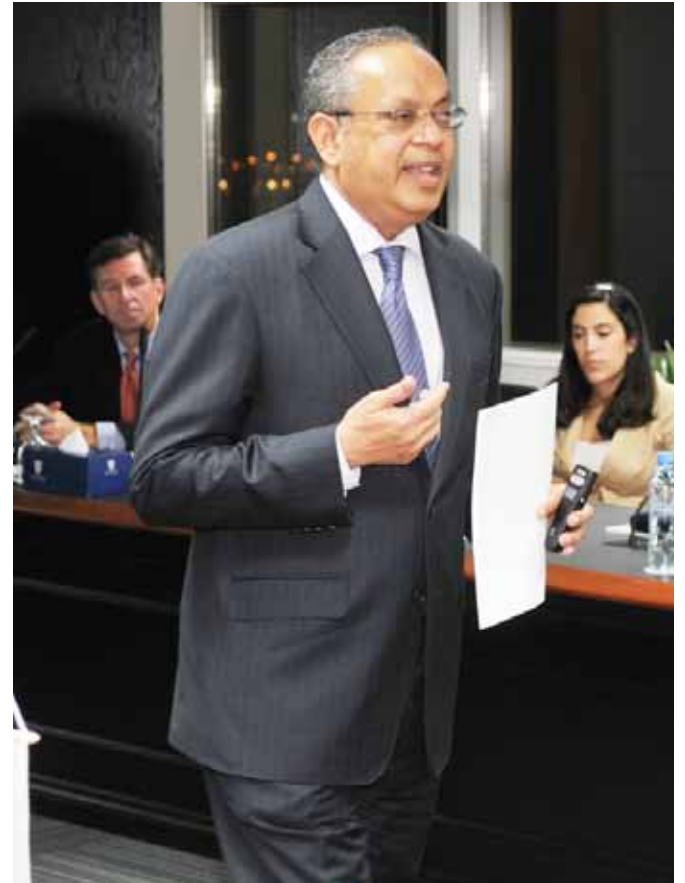
السفير سادا كمبر يوجه كلمته بمنتدى السياسات في كلية دبي للإدارة الحكومية.

وخلال حوار، أكد السفير كمبر على حاجة المسلمين للعمل معاً لتقوية بنية العالم الإسلامي، وجعله أكثر ازدهاراً وانفتاحاً من الناحية السياسية. ولما كان العالم الإسلامي يمثل 24% من سكان العالم ولكنه يحقق 8% من إجمالي الإنتاج المحلي، فقد أكد السفير على أنه خلال 60 عاماً، أو ما يعني ثلاثة أجيال، يمكن للعالم الإسلامي أن يصبح قوة كبرى على الصعيد الجغرافي السياسي إذا عزز مجتمعاته من خلال الإدارة الجيدة والمجتمع المدني وحقوق الجنسين والأقليات وسيادة القانون والشفافية والمصادقية والتعليم العالي.