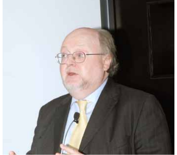
البروفيسور ستيف سميث

لخص البروفيسور سميث تأثير العولمة على تقدم التعليم العالي، حيث أن الجامعات وأنظمة التعليم العالي الوطنية تصبح أكثر اعتماداً على بعضها البعض لتحقيق النجاح، وتزايدت فرص التعاون والشاركة في مجال الأبحاث بفضل العولمة، كما أن الضغوط التنافسية التي تواجه الجامعات قد تضاعفت حيث أصبح باستطاعة الطلاب والعلمين السفر عبر العالم بحثاً عن أفضل الجامعات.