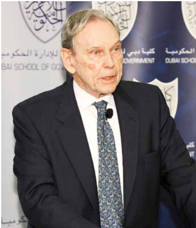
السفير ريتشارد ميرفي

أشار السفير إلى أنه بينما دعم الإسرائيليون بشكل كبير الهجمات على غزة، يوجد الآن شعور متزايد بالقلق، حيث يرى الكثيرون تراجع فرص التفاوض بشأن خيار إقامة دولتين. ووفقاً لما صرح به السفير ميرفي، أنه في غياب خيار إقامة الدولتين، تكون البدائل الثلاثة الباقية هي (1) التطهير العرقي للفلسطينيين من الضفة الغربية وقطاع غزة وضم إسرائيل التام لهذه المناطق، (2) تطبيق الديمقراطية الكاملة والمساواة بين الجميع في إطار دولة واحدة تشمل الضفة الغربية وقطاع غزة، و(3) ”استمرار حالة التخبط“ على شاكلة الوضع الراهن، حيث تفرض إسرائيل بموجبه نموذج متزايد وواضح من التفرقة العنصرية للحفاظ على الطبيعة اليهودية لإسرائيل مع استمرار احتلال الأراضي. وفي رأي ميرفي، يعد الخيار رقم 3 هو أكثر الطرق حظاً ولكن يدرك عدد كبير من الأمريكيين والإسرائيليين قصر أعمار الأنظمة العنصرية، ولهذا يسعون إلى حل إقامة الدولتين. وأشار ميرفي إلى التحول في الرأي العام الأمريكي باتجاه موقف أكثر توازناً فيما يتعلق بهذا الصراع.