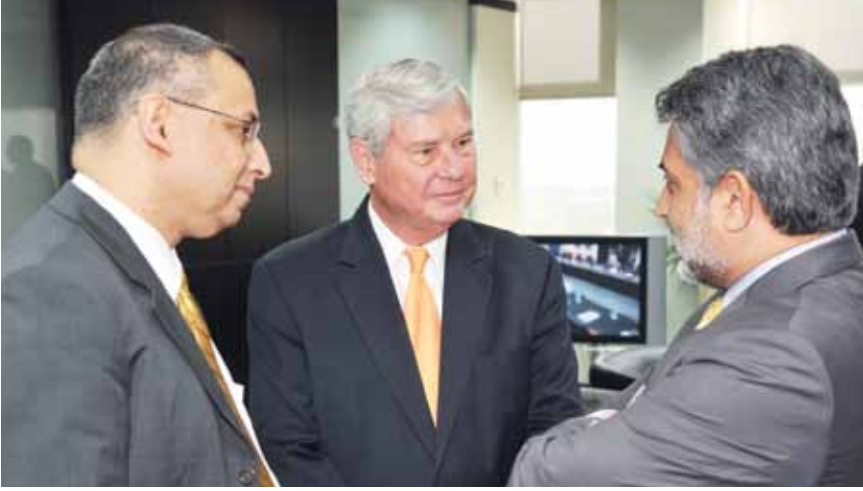
السيناتور بوب جراهام يتحدث مع بعض الحاضرين قبل المحاضرة

وهو يتبع أيضاً الأسلوب البراغماتي ولا يعتمد بشكل كبير على أية أيديولوجية لحل المشكلات في العالم الواقعي. وينتهج الأسلوب المتدرج في حل المشكلات وهو بارع في حل المشكلات الواحدة تلو الأخرى - وكذلك وضع الأهداف وإيجاد الحلول خطوة بخطوة“.