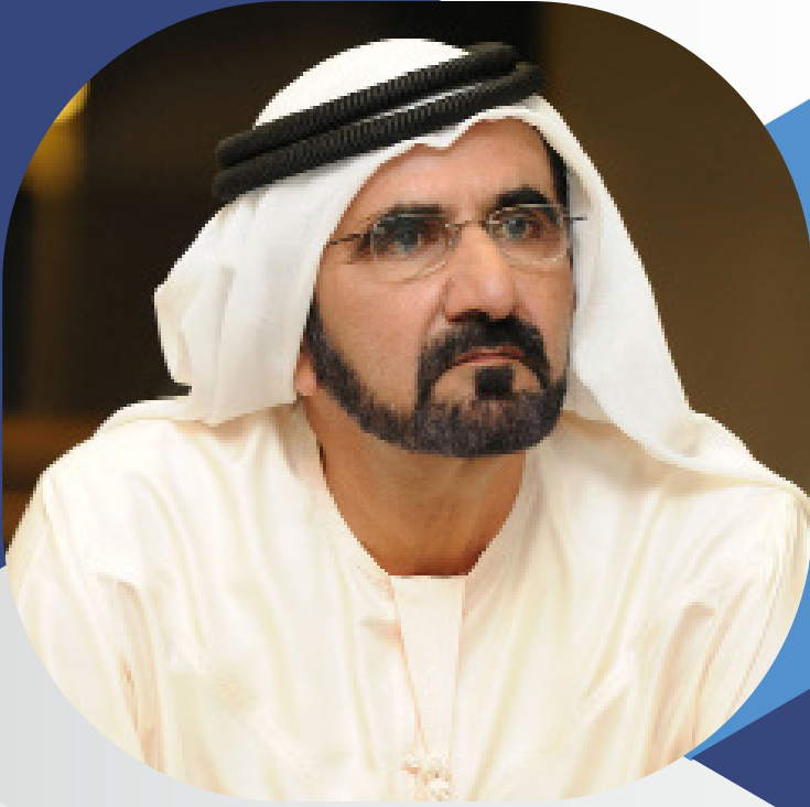
الشيخ محمد بن راشد آل مكتوم

” إِنَّ عَمَلِ الْحُكُومَاتِ لَا يَقْتَصِرُ عَلَى تَقْدِيمِ الْخِدْمَاتِ وَتَطْوِيرِهَا فَحَسَبٍ، بَلْ فِي إِحْدَاثِ التَّغْيِيرِ فِي نُظْمِ وَالْيَاتِ الْعَمَلِ. إِنَّ الْمُسْتَقْبَلَ عِبَارَةٌ عَنْ أَفْكَارٍ وَأَحْلَامٍ يَجِبُ صِنَاعَتُهَا وَتَجْرِبَتُهَا فِي مَخْتَبَرَاتٍ، وَالْمَبَادِرَةُ الْيَوْمَ تَجْعَلُ مِنْ دَبِي أَكْبَرَ مَخْتَبِرٍ لِلتَّجَارِبِ الْحُكُومِيَّةِ الْمُسْتَقْبَلِيَّةِ فِي الْعَالَمِ“.